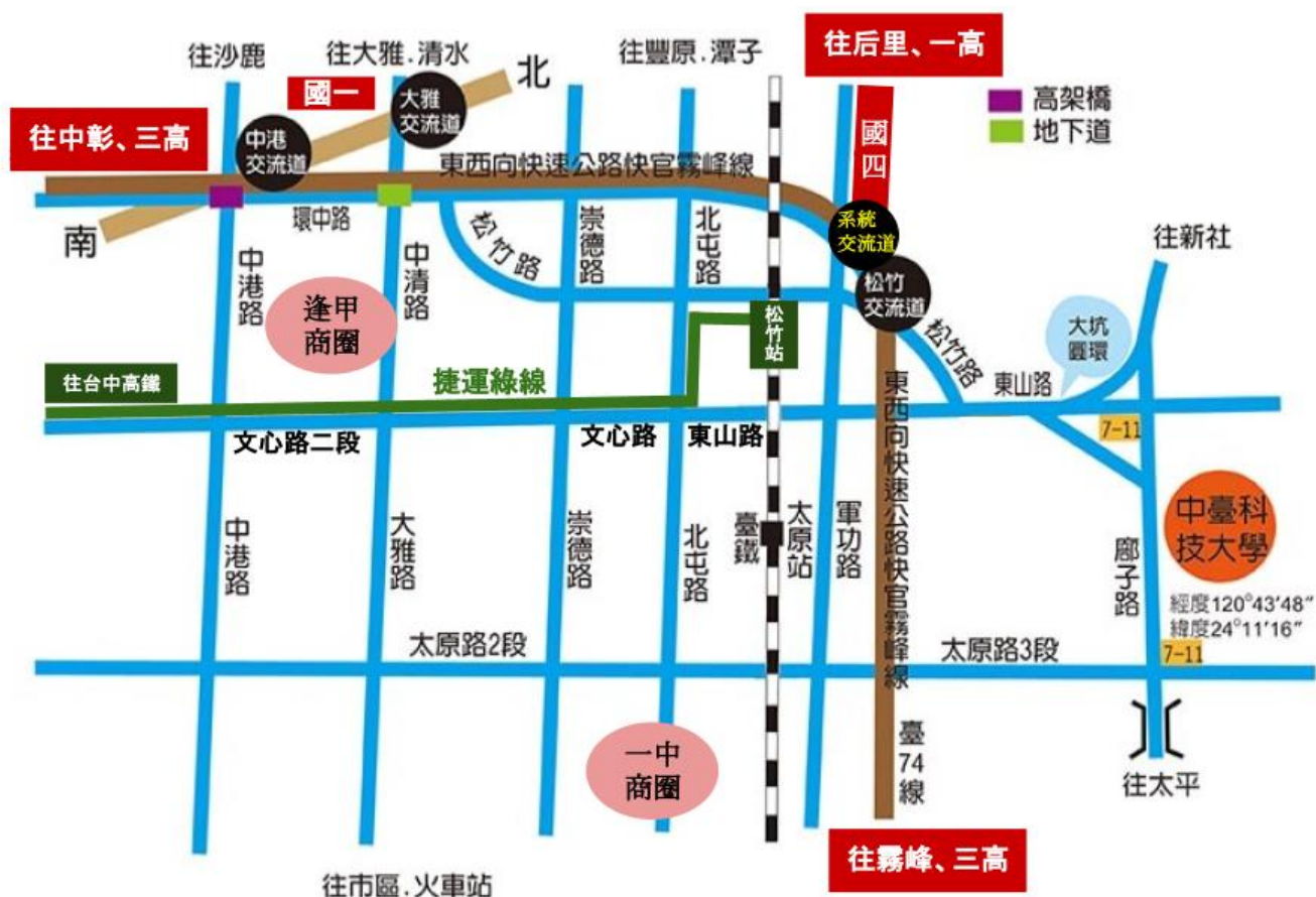
附錄一、本校校址交通位置圖