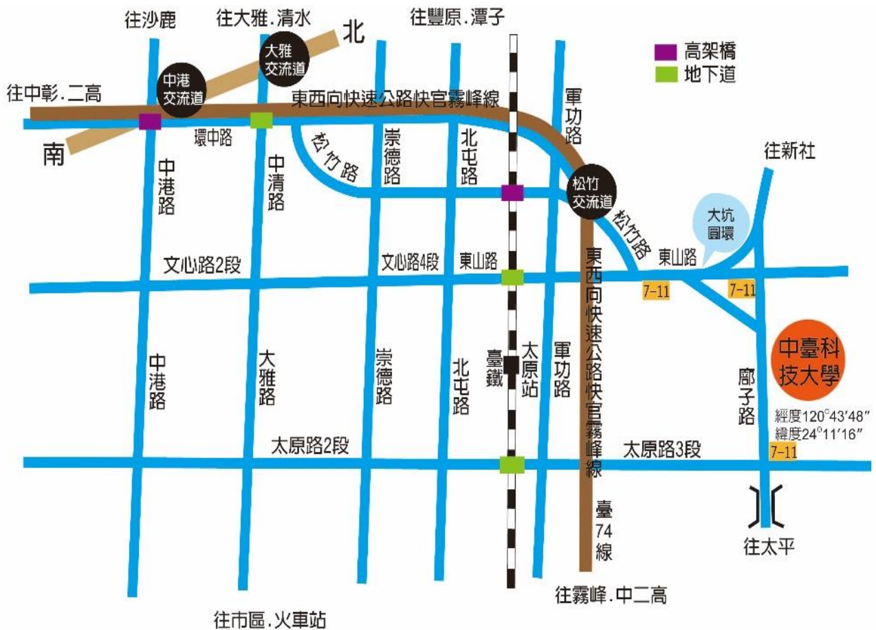
附錄二、本校校址交通位置圖